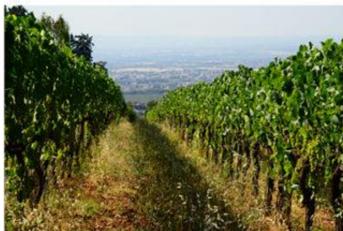
Vigne del frascatano

La città di Frascati è nota per le strutture ricettive e turistiche, prima fra tutte le famose fraschette dove nei primi dell'ottocento ed anche negli anni 50/60 si andavano a consumare pranzi e cene portati da casa, chiedendo all'oste la somministrazione del solo vino. A questa immagine antica, rurale, contadina e, forse legata ad un turismo povero insieme alla ripresa industriale, abbiamo l'obbligo di associare anche una realtà oggettiva che ci rende pieni di orgoglio, speranza e considerazione per il futuro.