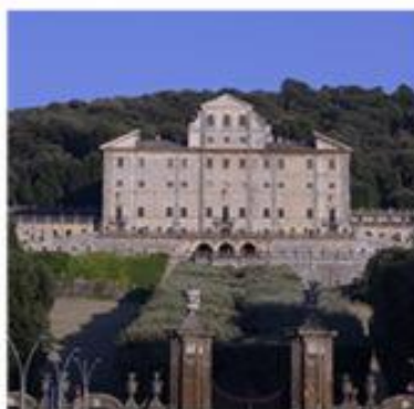
Vista di Villa Aldobrandini, Frascati

La vicinanza della Pro Loco alle attività culturali cittadine si è rivelata anche in occasione del Raduno Tuscolano dei Vigili del Fuoco in congedo che, proprio da questa associazione ha preso spunto. L'invasione del centro cittadino e di piazza Marconi, insieme a Villa Torlonia, ad opera dei mezzi rossi VVF, insieme agli uomini in divisa ed alle attrezzature pompieristiche hanno reso il cuore urbano gioioso e colorato, permettendo alla popolazione di avvicinare il Corpo Nazionale dei Vigili del Fuoco.