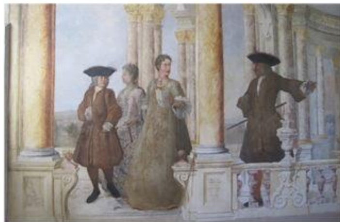
Dettagli di un affresco all'interno di Villa Aldobrandini