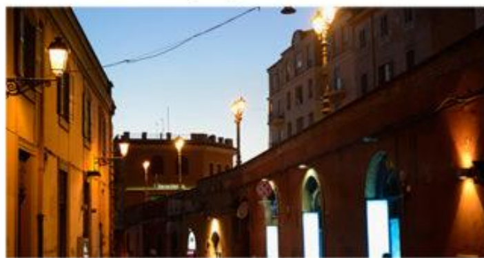
Vie di Frascati durante le passeggiate serali